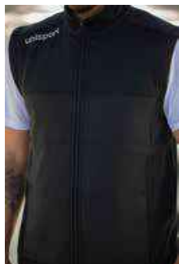
face avant matelassée