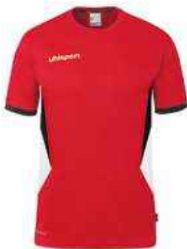
Maillot Réf. 1002370

Qualité professionnelle, confort optimal et style distinctif pour tous les membres de votre club de pétanque.