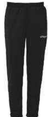
Pantalon CLASSIC Réf. 1005304