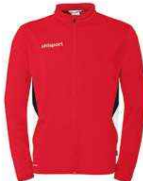
Veste Classic Réf. 1002373